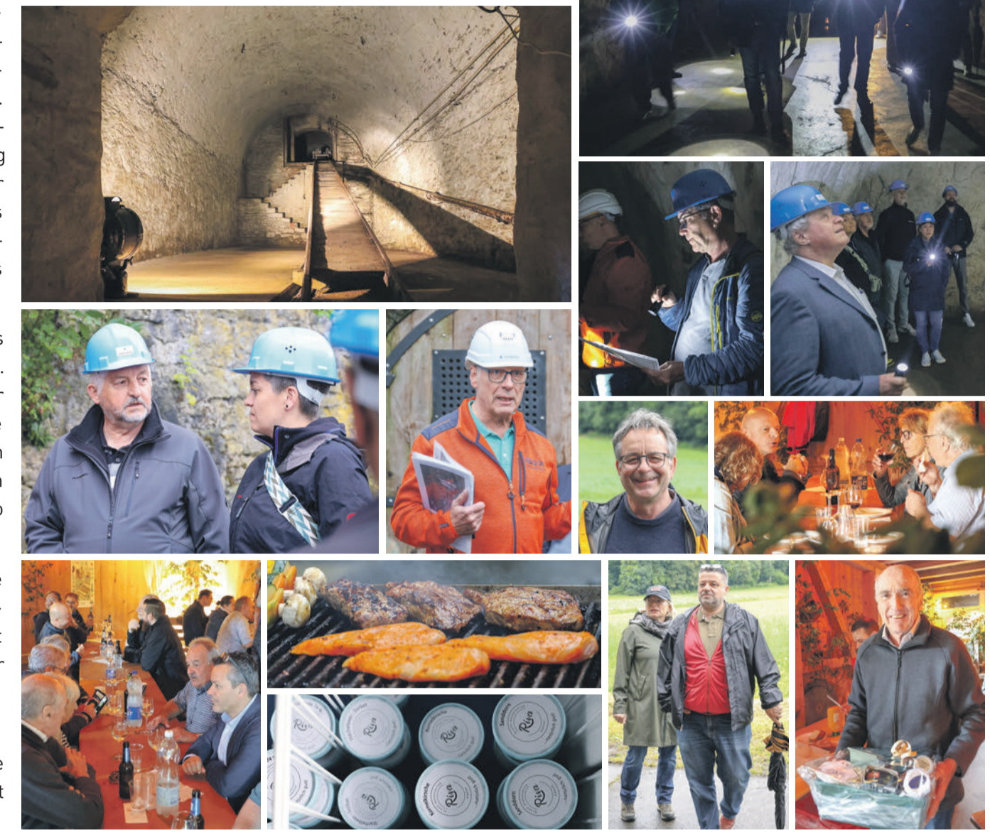
Fotos: Patrick Iseli, weitere Impressionen unter www.gewerbeverein-lenzburg.ch

Planen Sie einen speziellen Firmenanlass? Dann melden Sie sich für eine Besichtigung des Felsenkellers auf der Website www.industriekultur-aabach.ch . Der Verein kann Ihnen bestimmt etwas Spannendes und Passendes anbieten.