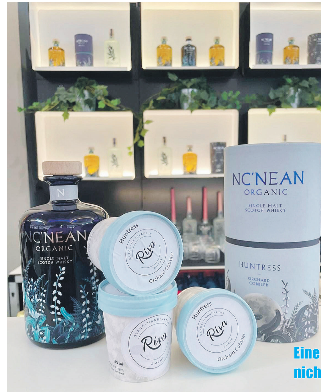
Eine Glacé-Kreation, nicht nur für Whisky-Liebhaber!

Für uns als GVL-Vorstand ist es schön zu sehen, wie unser Netzwerk funktioniert, tolle Zusammenarbeiten daraus entstehen und somit auch gelebt wird. Und seid gespannt, denn Los Hermanos und Riva Glacé-Manufaktur haben bereits eine nächste Idee: ein Gin-Sorbet.